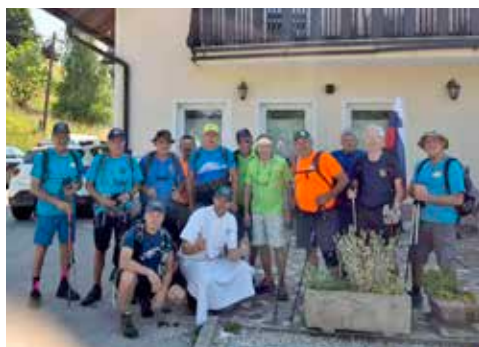
Zajtrk Pr Čop