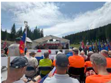
Na prizorišču slovesnosti