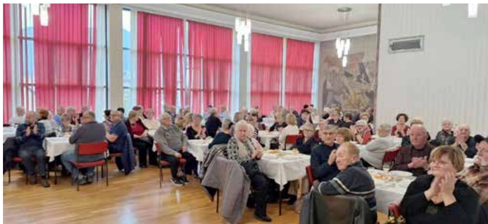
Srečanje starejših nad 70 let v KS Jože Marn in KS Toplice, 2024