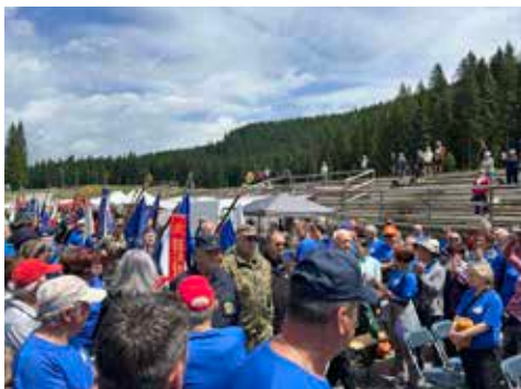
Prihod generalmajorja Ladislava Lipiča

Zapisal: Mojmir Maček