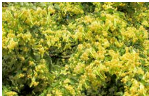
Lipa ( Tilia platyphyllos )