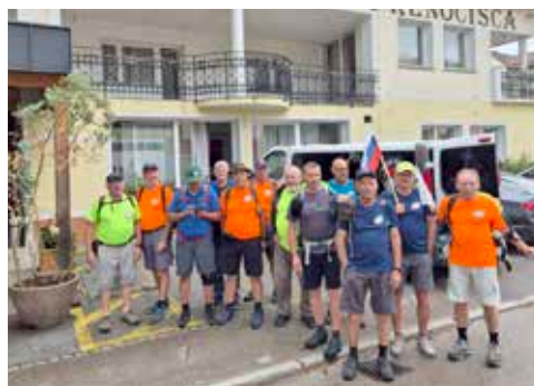
Slovo od Kovača