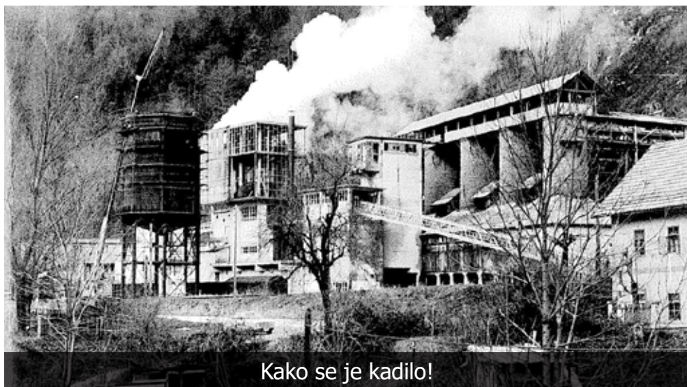
Kako se je kadilo!