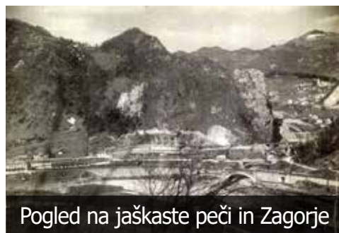
Pogled na jaškaste peči in Zagorje

TPD je v letih 1935-1937 zgradila štiri peči jaškastega tipa, po drugi svetovni vojni so zgradili še preostali dve tako, da je baterijo sestavljalo skupaj šest peči enakega tipa. Še vedno pa so apno proizvajali s štirimi poljskimi pečmi. Produkcija žganja apna je znašala 105 ton apna na dan oziroma letno 32 000 ton. V letih 1954/55 je Rudnik zgradil še dve jaškasti peči, in sicer iz materiala 6 opuščenih poljskih peči.