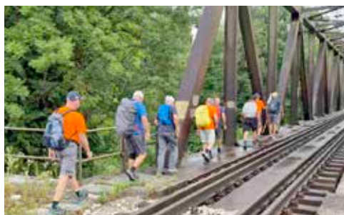
Pripis k sliki