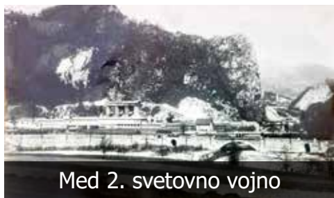
Med 2. svetovno vojno