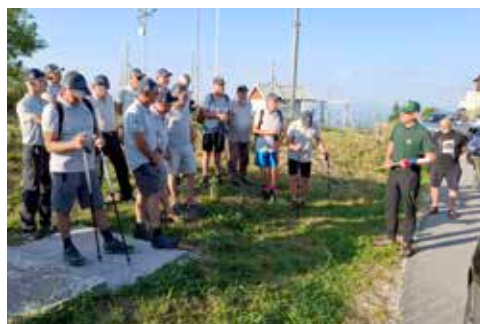
Predsednik OZVVS Zasavje predaja pohodnikom prapor